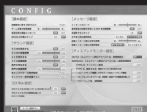
[CONFIG (設定) 画面]