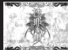
[タイトルメニュー画面]

BGM・歌を試聴することができます。「REPEAT」ボタンで繰り返し再生されます。