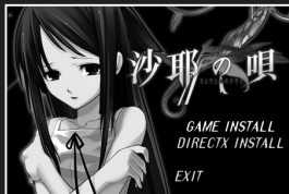
[インストール画面]

本製品のGAME DISC(CD-ROM)をドライブに挿入するとインストールメニュー画面が立ち上がります。メニュー画面内のインストールボタンをクリックすると、セットアッププログラムが立ち上がります。画面の指示に従い操作を進めて下さい。最初に製品シリアルタイアログが表示されます。パッケージに同梱されているハガキに製品シリアルが印字されていますので、製品シリアル番号をダイアログ欄に入力しOKボタンを押して下さい。インストールされる容量が表示された後、セットアッププログラム終了のメッセージが表示され、ゲームが起動します。次回以降の起動には、デスクトップのゲームアイコンをダブルクリックもしくは、「スタート」→「すべてのプログラム」→「Nitroplus」→「沙耶の唄 The Best」→「沙耶の唄 The Best」を選択するとゲームが起動します。CD-ROMをドライブに入れてもオートスタートが始まらない場合、CD-ROM内にある、SAYAsetup.exeをダブルクリックして下さい。インストールメニュー画面が立ち上がります。